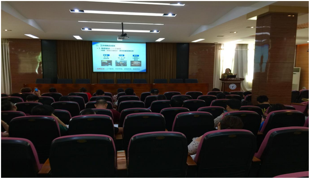
图2 严把质量关，坚守“生命线”专题讲座