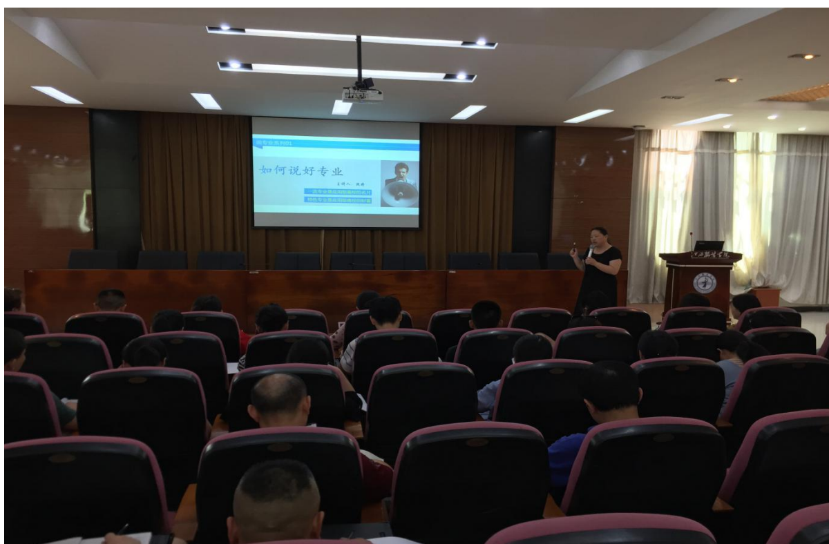
图 1 如何做好专业负责人专题讲座

为帮助我校教研室主任、专业负责人更好地履行工作职责，提升业务能力，8月1日，由教师教学发展中心牵头，教务处、质量监测与评估中心承办的业务培训工作在我校行政楼一楼报告厅顺利开展，本次培训紧扣我校教学工作重点，内容丰富，针对性强。教务处处长段婷、质量监测与评估中心主任周文辉、服装设计学院骨干教师兼校督导邓琼华三位老师分别做专题讲座。