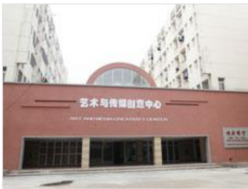
艺术传媒创新中心